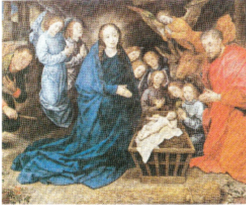
Hugo van der Goes - Anbetung der Hirten (Ausschnitt)

gemeinsames Singen von alten und neuen Weihnachtsliedern